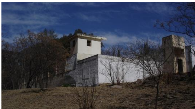
“Campo de la Ribera”

Centros Clandestinos de Detención Tortura y Exterminio (CCDTyE) más grandes dentro del aparato represivo de la última dictadura cívico militar.